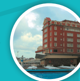
HESPERIA A CORUÑA