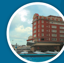
HESPERIA A CORUÑA 4*DUI 115€