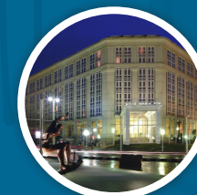
MELIÁ MARÍA PITA 4*DUI 115€