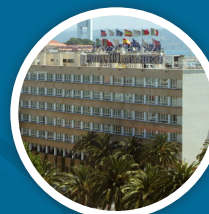
NH ATLÁNTICO 4*DUI 130€

Sujeto a disponibilidad Precio por habitación y noche incluyendo desayuno IVA NO INCLUIDO