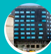
AYRE HOTEL GRAN VÍA 150 EUROS