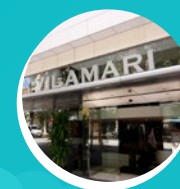
HOTEL VILAMARI 160 EUROS