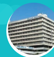
EXPO HOTEL BARCELONA 130 EUROS