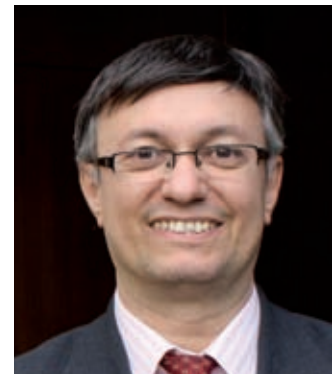
Dr. Miguel Belmonte.

El contexto de restricciones económicas actuales hace que mantener el nivel de actividades y congresos alcanzados en años anteriores sea un reto importante, pero no insuperable. Es necesario recurrir a la imaginación para descubrir nuevas vías y hacer comprender a la industria farmacéutica que su colaboración sigue siendo fundamental, por lo que hay motivos y bases para que se mantenga su apoyo habitual a congresos y actividades investigadoras y docentes. Ahora es más necesario que nunca y no debe decaer. En todo caso, está claro que los presupuestos actuales se han reducido, y, por tanto, tenemos también que controlar mejor los gastos de nuestra propia Sociedad. En este sentido, estamos en un proceso de remodelación interno de la SVR que sentará las bases correctas para un mejor funcionamiento de la propia Sociedad.